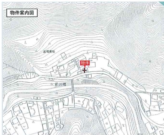
ライフレーション